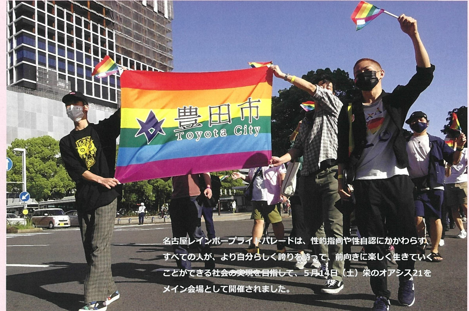
名古屋レインボープライドパレードは、性的指向や性自認にかかわらず、すべての人が、より自分らしく誇りを持って、前向きに楽しく生きていくことができる社会の実現を目指して、5月14日(土)栄のオアシス21をメイン会場として開催されました。