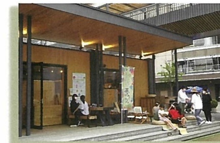
「とよしば」での「ゆるっと♡ほけんしつ」の様子。