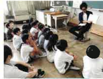
読み語りの様子

PTA会長を務めていた年に校長先生と2人で、卒業する6年生へのはなむけとして絵本を読んで欲しいと依頼され、10数冊の絵本の中から選んだのが、絵本作家きむらゆういち先生の「あらしのよるに」シリーズの2作目「あるはれたひに」でした。夜遅くまで何度も練習し、懸命に読みました。こどもたちがとても真剣に聴いてくれたので、翌年度から学期毎(当時は3学期制)に1冊ずつ読むことにしました。ある時、ある小学校で地域のおじさんたちが全校で絵本を読んだと聞き「平井小学校でもできるのではないかと考え、区長やPTA役員、保護者など地域の知り合いの皆さんに声をかけました。以来、年に1回、その都度メンバーを募り、多くのおじさんたちの参加をお願いし続けてきました。